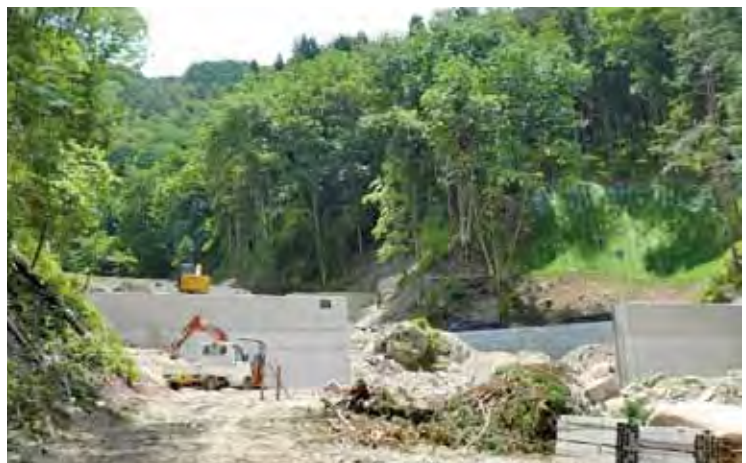
滝ヶ洞地区工事状況(R4年6月撮影)