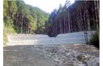
スリット設置H30・治山ダム完成R1