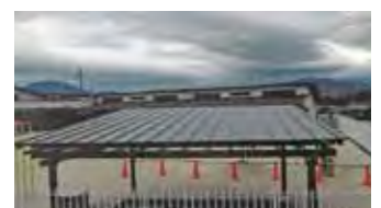
里2：坂本こども園砂場屋根