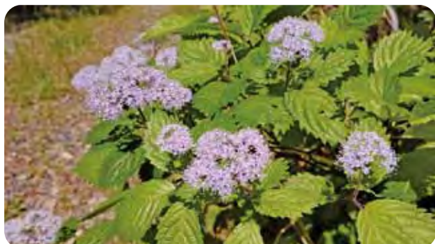
源根の森【紫陽花(アジサイ)】

(注2) 具体的な事業計画につきましては、本財団ホームページに掲載しておりますのでご覧ください。