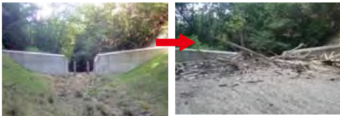
H27施工(R2年5月撮影)・R2年7月災害後(撮影)