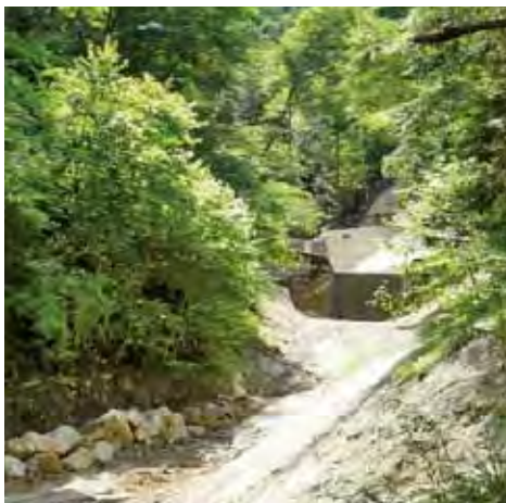
洗井沢地区工事状況(R4年6月撮影)