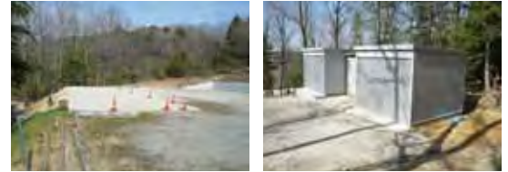
【茄子川マレットゴルフ場の改修】

茄子川地域のみでなく他の地域の多くの皆さんにご利用いただいているマレットゴルフ場は、コロナ禍の影響で施設の臨時休業を余儀なくする期間がありましたが、その間に特定費用積立金を取崩し、駐車場の拡張工事並びに倉庫の改修工事を行いました。