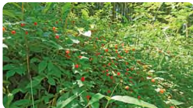
源根の森【野イチゴ】