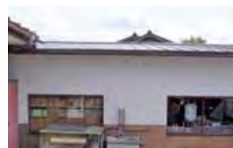
1：新町会館屋根修理