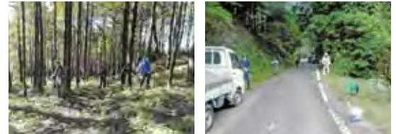
【源根の森 森林保全作業】

茄子川地域のみでなく他の地域の多くの皆さんにご利用いただいているマレットゴルフ場は、コロナ禍の影響で施設の臨時休業を余儀なくする期間がありましたが、その間に特定費用積立金を取崩し、駐車場の拡張工事並びに倉庫の改修工事を行いました。