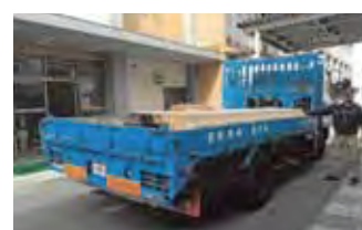
里1：中津川工業高校実習用木材