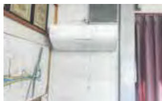
1-3 東三クラブ空調設備