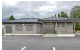
1-1 東諏訪クラブ新築