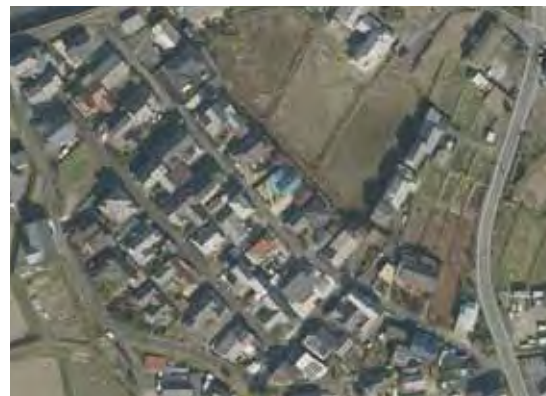
【茄子川地域の活性化・住宅地賃貸】