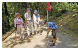
2-7 マレットゴルフ愛好会