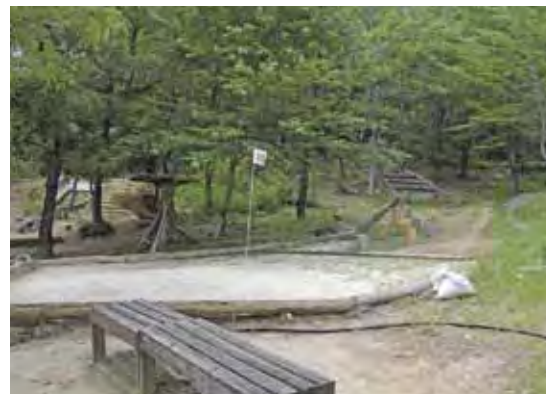
【健康増進・娯楽の場茄子川マレットゴルフ場】

年齢に応じて安く気軽に楽しめるマレットゴルフを通して、健康増進・生きがいの高揚を図ります。