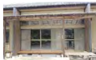
1-2 下洗井クラブ耐震補強